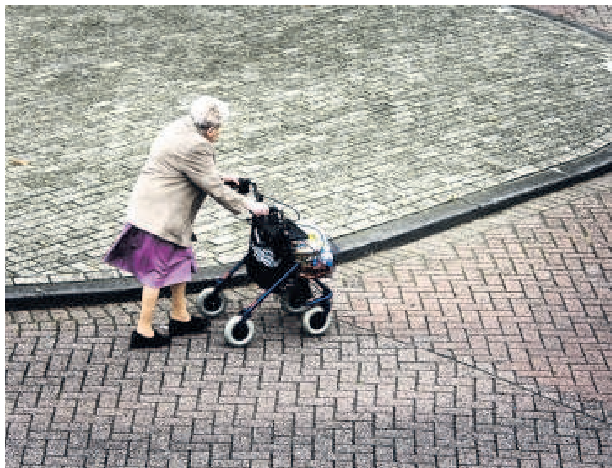
'De AOW is best betaalbaar te houden, als de politieke wil er zou zijn.'